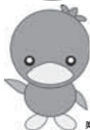
美里町マスコット ミムリン