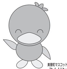
美里町マスコット ミムリン