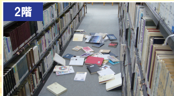
2011年東北地方太平洋沖地震のときの 東京都内のビルの室内の様子