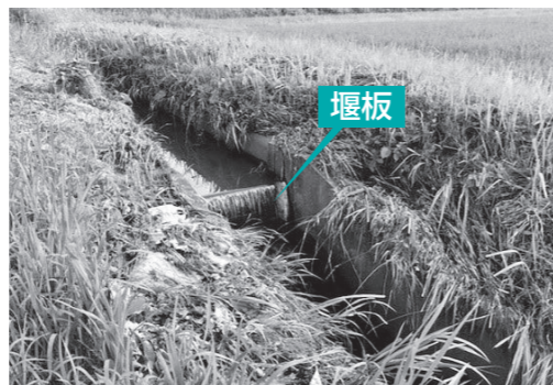
▲堰板が設置してある排水路

なお、その際には、台風や豪雨の到来前に、身の回りの安全を確保したうえで作業をお願いします。