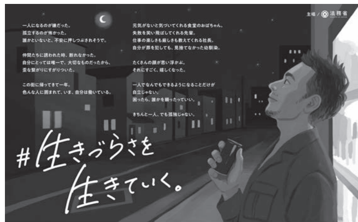
犯罪や非行を防止し、立ち直りを支える地域のチカラ 第73回 社会を明るくする運動

「社会を明るくする運動」は、すべての国民が、犯罪や非行の防止と罪を犯した人たちの更生について理解を深め、それぞれの立場において力を合わせ、犯罪や非行のない安全で安心な社会を築こうとする全国的な運動です。