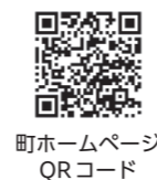
町ホームページ QRコード