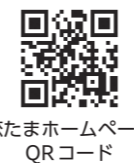
恋たまホームページ QRコード